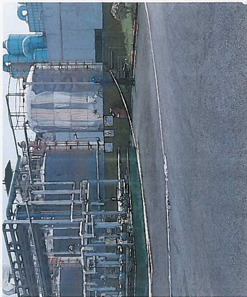
警戒保卫组设置警戒线