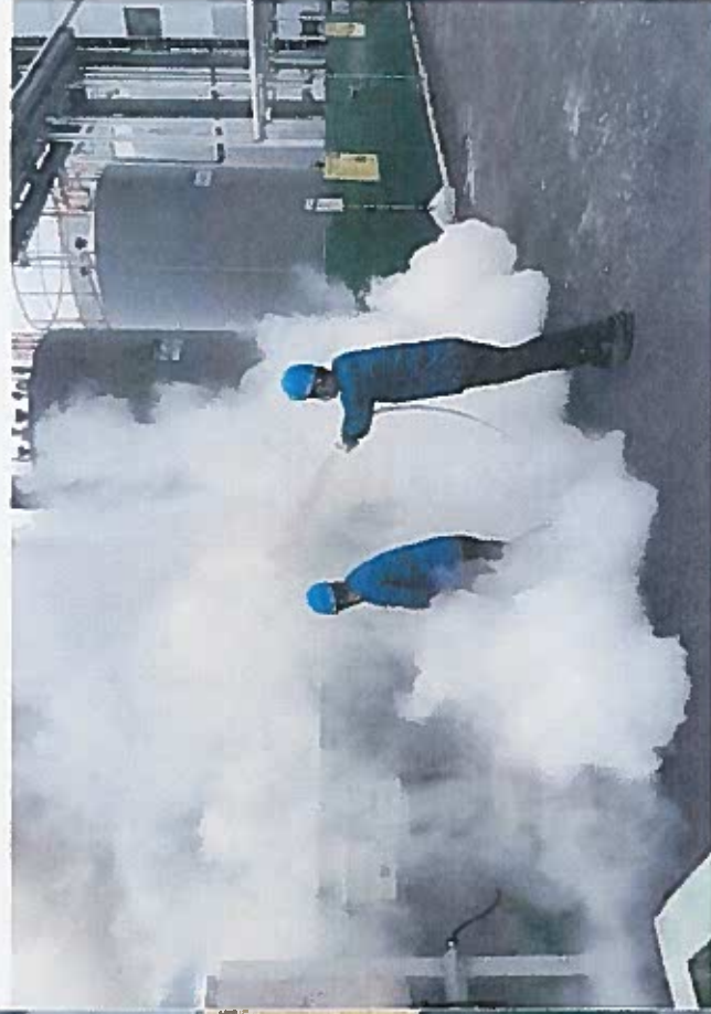
拿就近的灭火器进行灭火