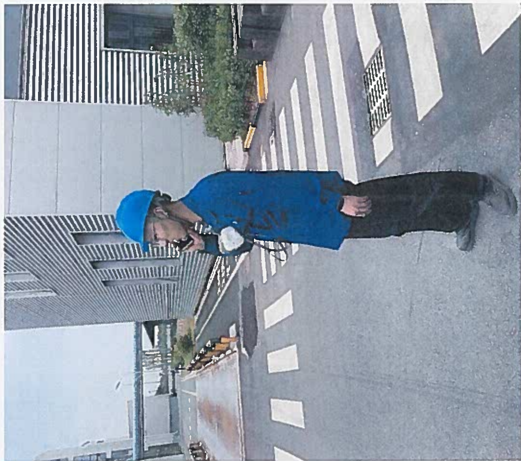
拨打 120 急救电话