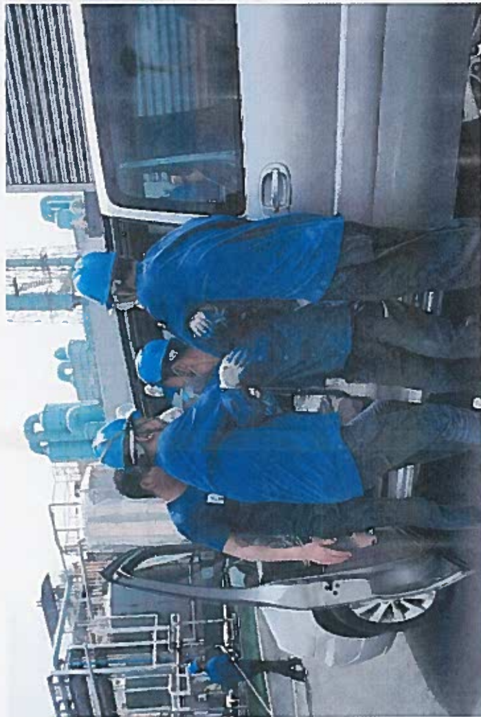
医疗救护组对受伤人员进行简单的救护，无反应后立即把受伤人员抬至车上送往最近的金坛区中医院。