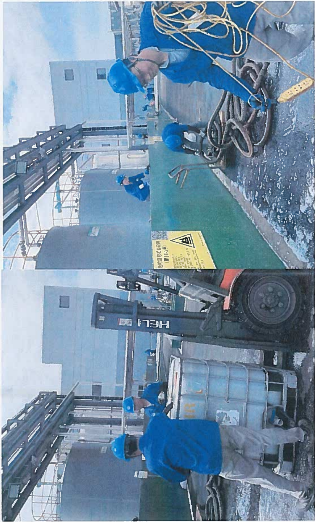
把围堰内应急水统一打入吨桶，送到 3#仓库按照水处理流程处理。