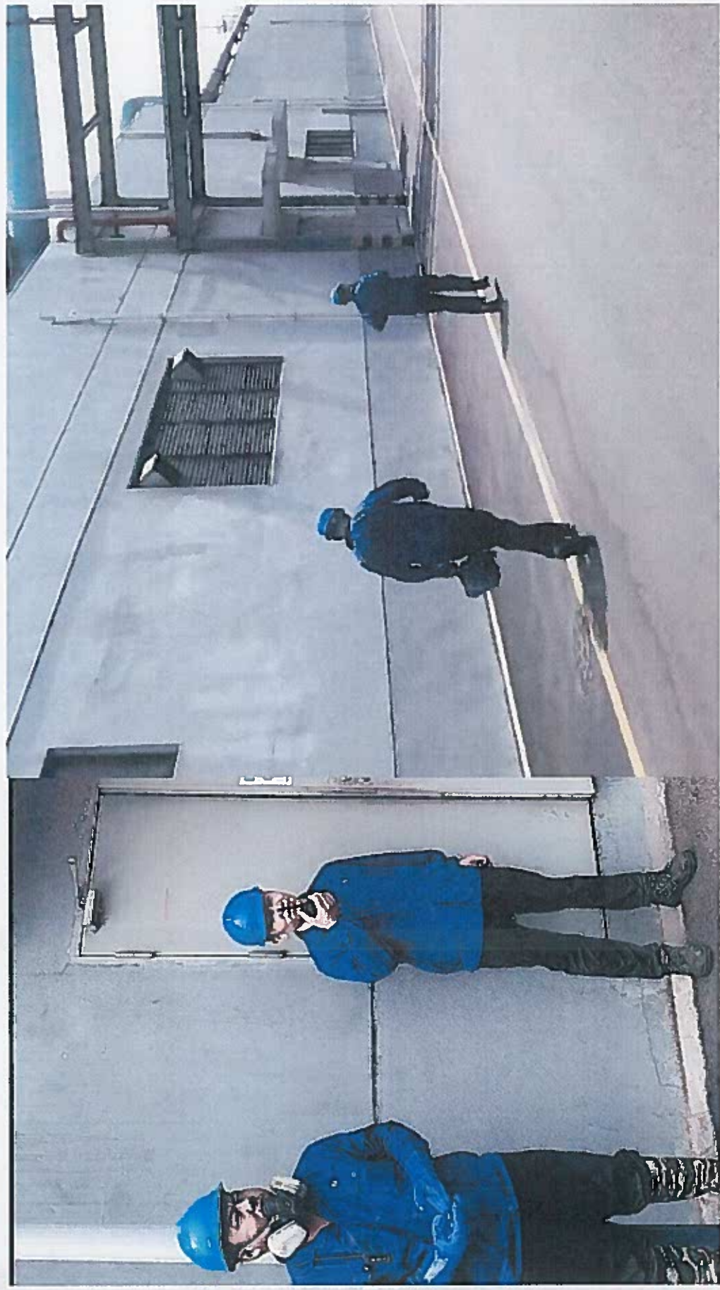
设备抢修组对讲机通知电工对罐区进行断电