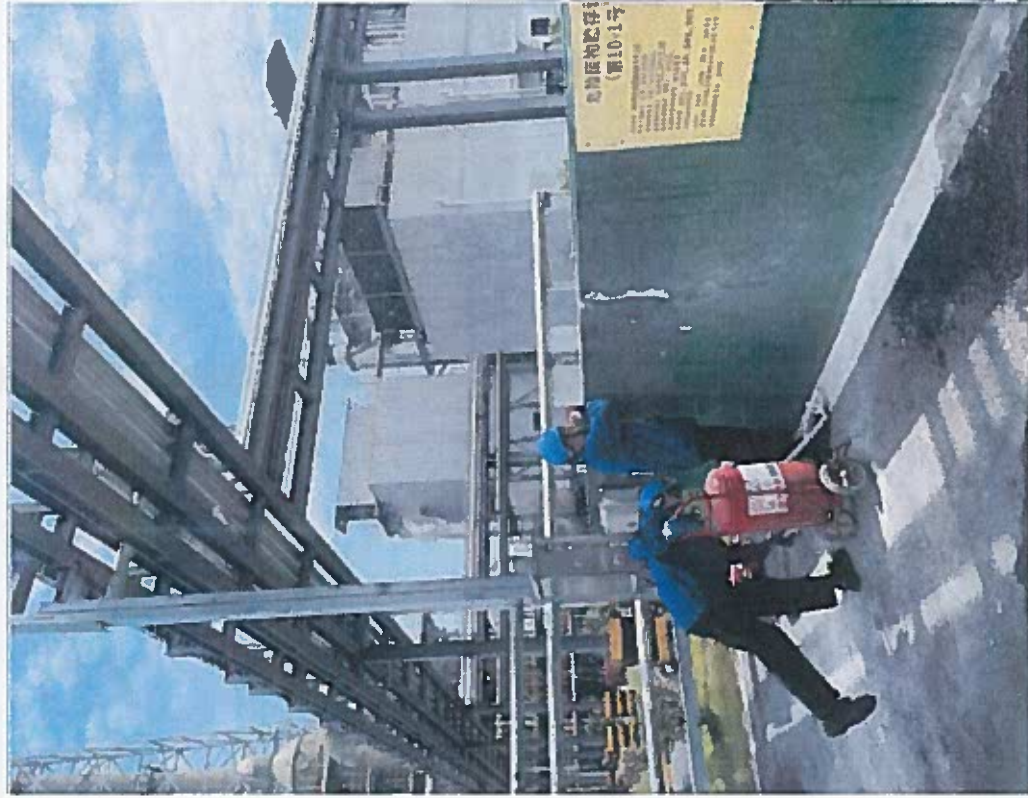
模拟情况，发现火情后上报